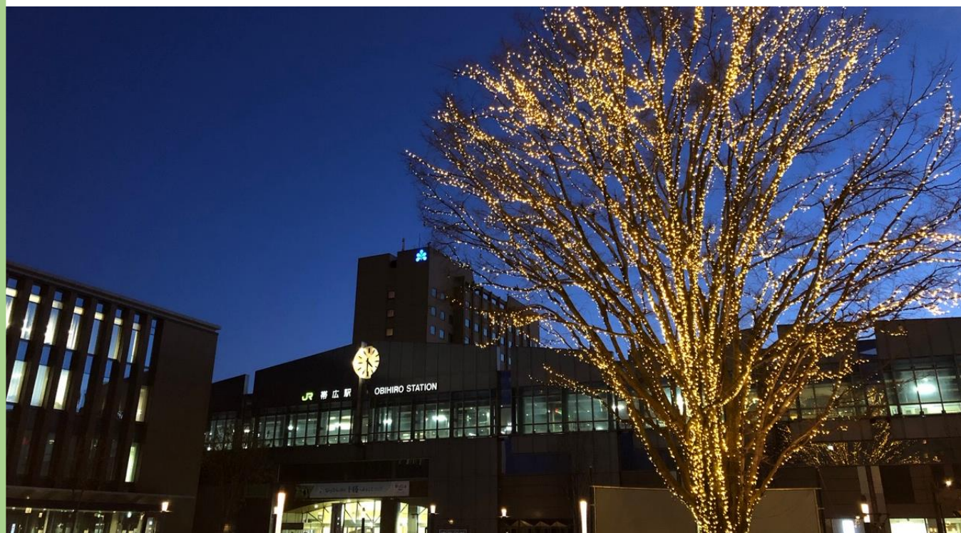
帯広駅前イルミネーション