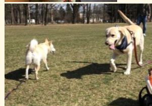
▲茶丸ちゃんとロイ君