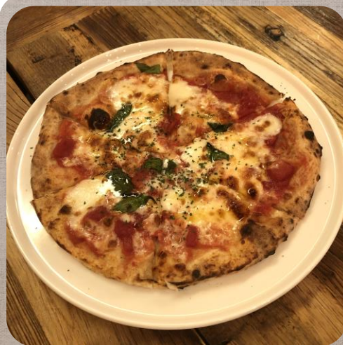
▲ナポリピッツァM 550円