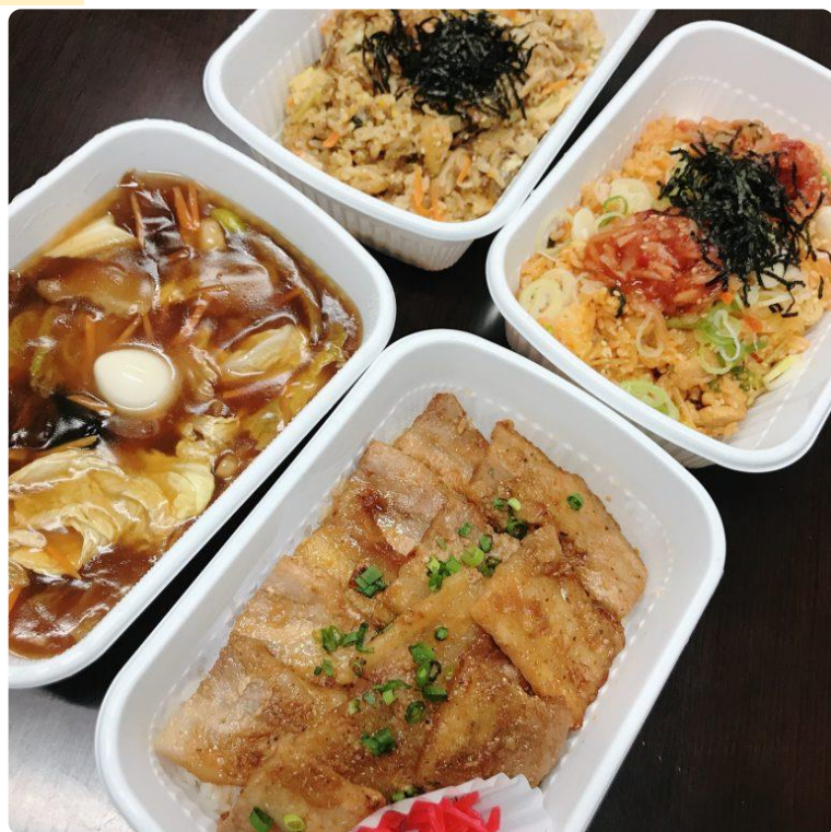
▲右上から時計回りに、「石焼キムチチャーハン」「南大門の豚丼」「あんかけやきそば」「石焼ビビンバ」

テイクアウトメニューは、お肉ももちろんできます。店内飲食よりお得な価格になっており、プレートにすることも可能です。また、今回予算の関係で注文できませんでしたが、焼肉弁当もありますよ！